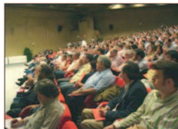
Vista parcial de la sala de la I Convención de Técnicos y Cuadros de UGT

Desde la ATC (Agrupación de Técnicos y Cuadros) de la FeS , nos ponemos manos a la obra.